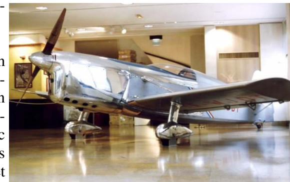
Le RL-21 exposé au Conseil Général

L' exposition "L'AVENTURE DU CIEL" organisée au Conseil Général en 1997/98 par les Archives Départementales et l'Aéroscope avec le concours de la CCI, d'Airbus et d'autres partenaires locaux et régionaux donne aux "Aéroplanes" une fantastique occasion de présenter leurs collections dans un cadre très valorisant.