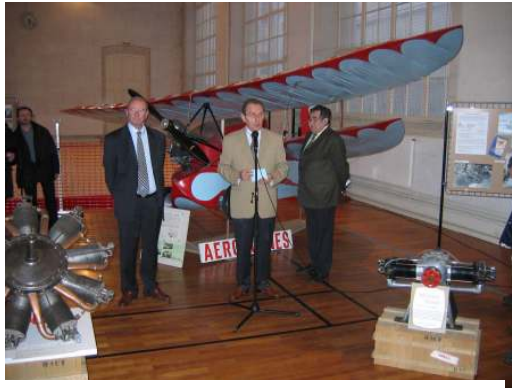
Au Lycée Clemenceau avec le Proviseur

En février, "Les Aéroplanes" ont participé aux journées portes ouvertes du lycée Clemenceau de Nantes, en exposant une partie de leurs collections sous l'intitulé " Des Moteurs et des Ailes " et en organisant deux conférences : "Un siècle d'aviation en Loire-Atlantique" et "Les carrières de l'aéronautique"