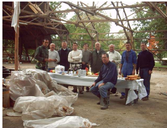
Pendant le démontage, une pause conviviale et méritée.