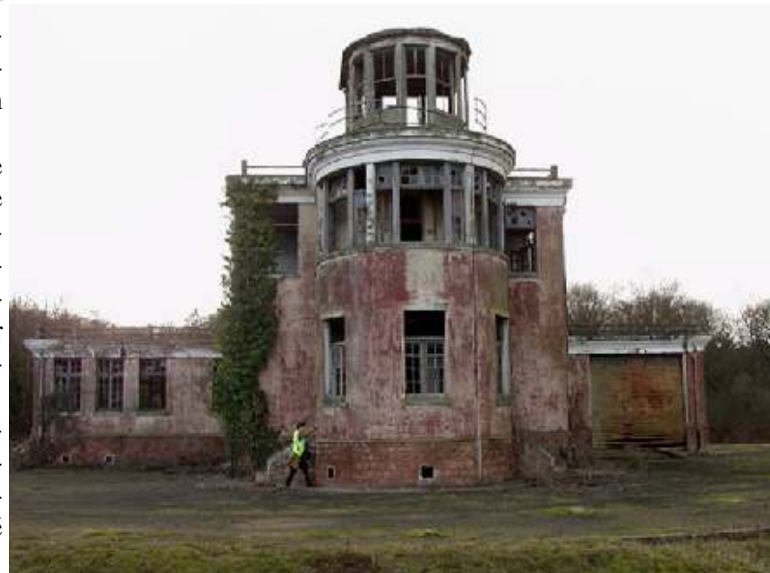
La tour Anglaise de 1939

Le compte-rendu complet de l'AG est disponible sur le site Internet ( http://www.aeroscope.org/ ) au format PDF, où il peut être téléchargé.