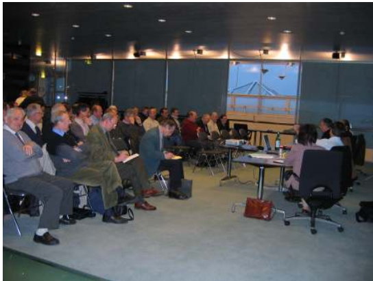
L'AG du 5 mars et son nombreux public